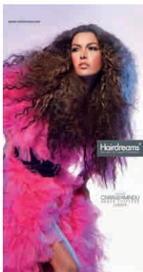
Flaga reklamowa 72 x 149 cm 1.200 Punkt bonusowy