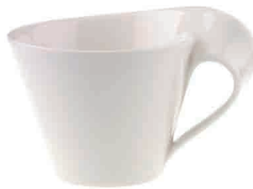
Cafè-au-Lait-Set 6 sztuk 16.000 Punkt bonusowy