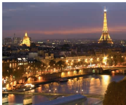
Paryż lub inne europejskie miasto 4 dni, 2 PAX 130.000 Punkt bonusowy