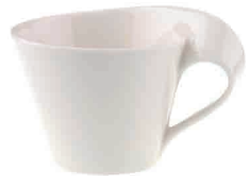
Cappuccino-Set 6 sztuk 16.000 Punkt bonusowy