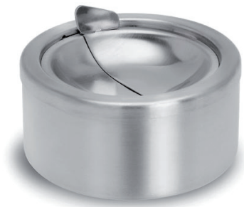
Popielniczka ze szlachetnej stali Blomus „Patty“ 1.000 Punkt bonusowy