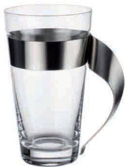
Latte-Macchiato-Set 6 sztuk 11.000 Punkt bonusowy