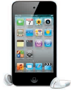
Apple iPod touch, 8GB 13.000 Punkt bonusowy