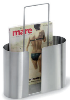
Stojak na czasopisma „Seamo“ 5.500 Punkt bonusowy