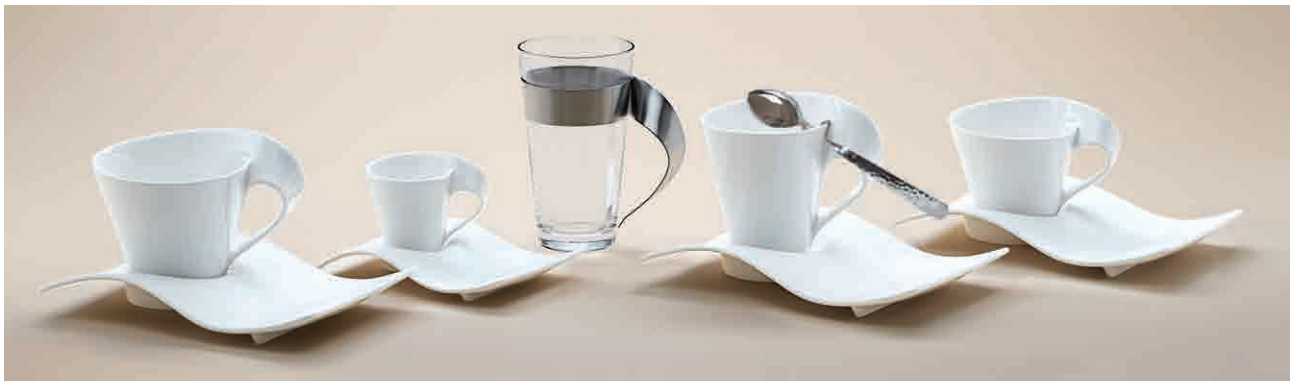
Villeroy & Boch „New Wave“ stolarz