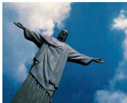
10 dni Brazylia, 2 PAX 300.000 Punkt bonusowy