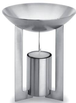
świecek zapachowe Blomus „Cino“ 2.300 Punkt bonusowy