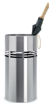
Stojak na parasole „Slice“ 5.500 Punkt bonusowy