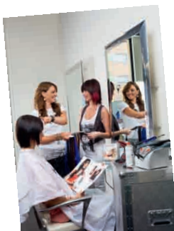
Hairdreams szkolenie dla salonu 26.000 Punkt bonusowy