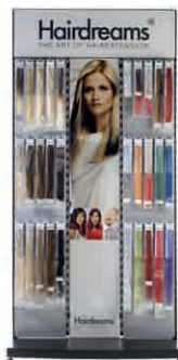
Pełny duży Merchandiser 130.000 Punkt bonusowy