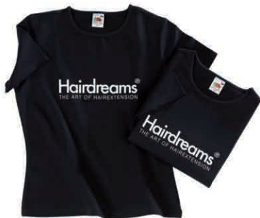
Hairdreams T-Shirt 600 Punkt bonusowy

Hairdreams koszulka z napisem z kryształków Svarowskiego // 1.200 Punkt bonusowy