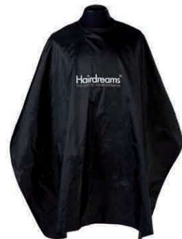
Hairdreams Pelerynka 800 Punkt bonusowy