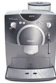
Siemens TK56001 26.000 Punkt bonusowy