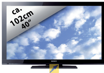
ca. 102cm 40" Sony TV KDL-40 BX 420 BAEP 102 cm 36.000 Punkt bonusowy