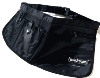
torba na narzędzia 1.000 Punkt bonusowy