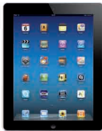
Apple iPad 2, Wifi +3G 16GB // 36.000 Punkt bonusowy 32GB // 41.000 Punkt bonusowy 64GB // 44.000 Punkt bonusowy