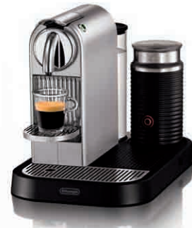
DeLonghi ESAM 6700 Prima Donna 90.000 Punkt bonusowy