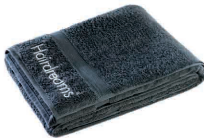
HD Ręcznik kąpielowy 80 x 150 cm 1.300 Punkt bonusowy