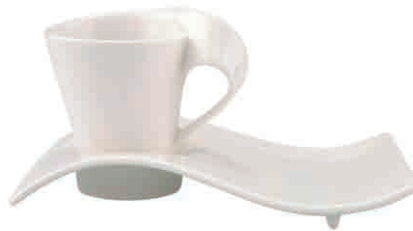
Espresso-Set 6 sztuk 15.000 Punkt bonusowy