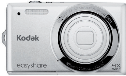
Kodak Easyshare M522 5.500 Punkt bonusowy