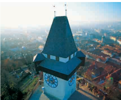
Weekend Stmk 2 PAX 80.000 Punkt bonusowy