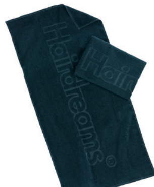
Hairdreams ręcznik 50 x 100 cm 700 Punkt bonusowy