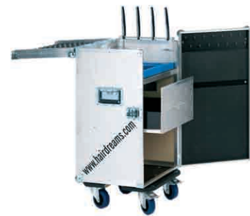
Hairdreams stacja serwisowa 17.000 Punkt bonusowy