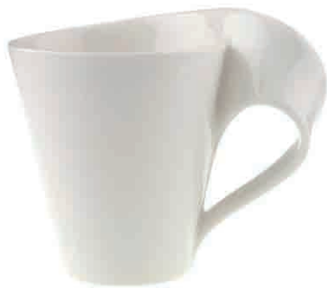
Häferl-Set 6 sztuk 16.000 Punkt bonusowy